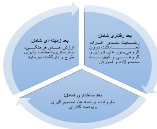
شکل ۲- مدل نظری پژوهش با توجه به ابعاد مدل سه شاخگی و زیرمولفه های آن

بنابراین طبق یافته های به دست آمده، جهت آسیب شناسی یک سازمان یا یک الگوی آموزشی می توان با استعانت از مدل سه شاخگی به بررسی ابعاد ساختاری، زمینه ای و رفتاری آن پدیده پرداخت و در این پژوهش طبق مطالعات انجام شده مهمترین زیرمولفه های هر بعد از مدل سه شاخگی با توجه به نظر متخصصین و خبرگان تعیین و به صورت شکل زیر متصور می گردد.