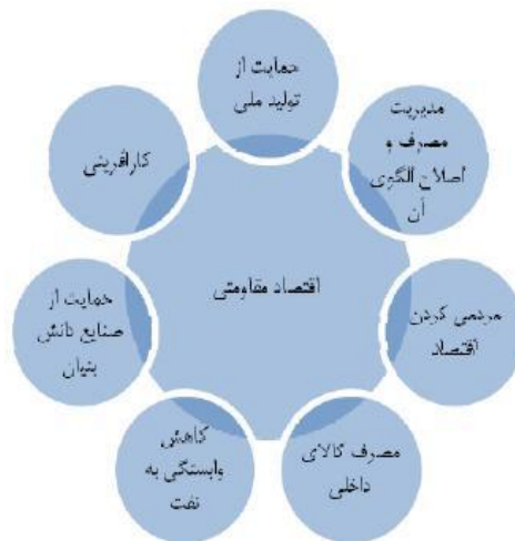
شکل ۳- ابعاد اقتصاد مقاومت

د) اقتصاد الگو؛ چهارمین تعریف نیز این است که اساساً اقتصاد مقاومتی یک رویکرد کوتاه مدت سلبی و اقدامی صرفاً پدافندی نیست؛ بلکه الگویی کاملاً بلند مدت است که در تمام افکار و حرکات مسئولان نمود واقعی و عینی دارد. در این رویکرد، ما در پی "اقتصاد ایده‌آلی" هستیم که هم اسلامی باشد و هم ما را به جایگاه اقتصاد اول منطقه برساند؛ اقتصادی که برای جهان اسلام الهام‌بخش و کارآمد بوده و زمینه‌ساز تشکیل "تمدن بزرگ اسلامی" باشد. بدین معنا اساساً در الگوی اسلامی ایرانی پیشرفت، یکی از مؤلفه‌های مهم الگو میباید متضمن مقاومت و تحقق آن باشد. در این مقوله است که اقتصاد مقاومتی مشتمل بر اقتصاد کارآفرینی و ریسک‌پذیری و نوآوری میشود. بنابراین با توجه به انواع چهارگانه اقتصاد در منظر اقتصاد مقاومتی می‌توان مؤلفه‌های آن را مطابق شکل زیر در نظر گرفت